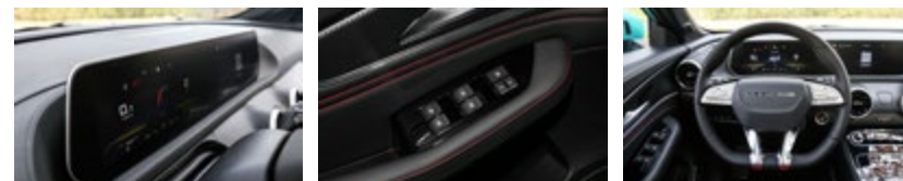
Equipamiento incluido: •

Nos reservamos el derecho de actualizar, cambiar o reemplazar cualquier especificación sin previo aviso