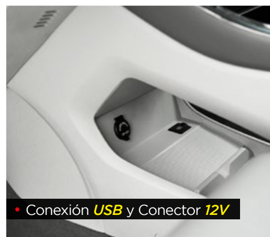
• Conexión USB y Conector 12V