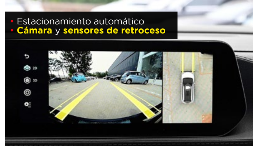
• Estacionamiento automático • Cámara y sensores de retroceso