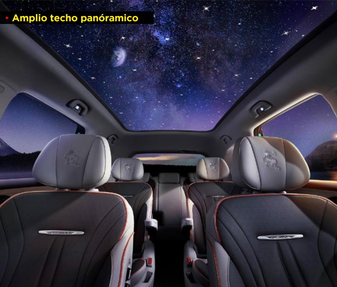
• Amplio techo panorámico