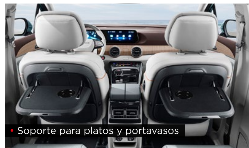
• Soporte para platos y portavasos