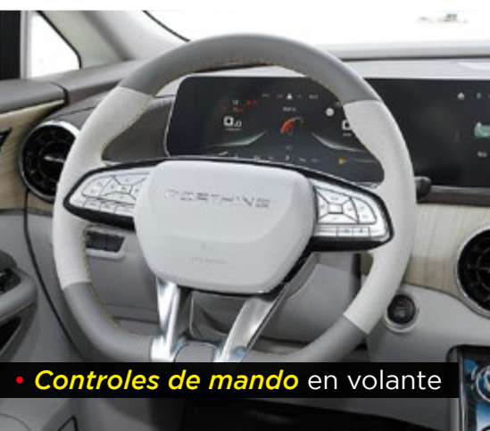
• Controles de mando en volante