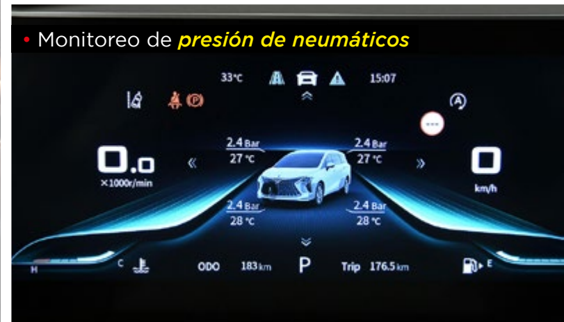
• Monitoreo de presión de neumáticos