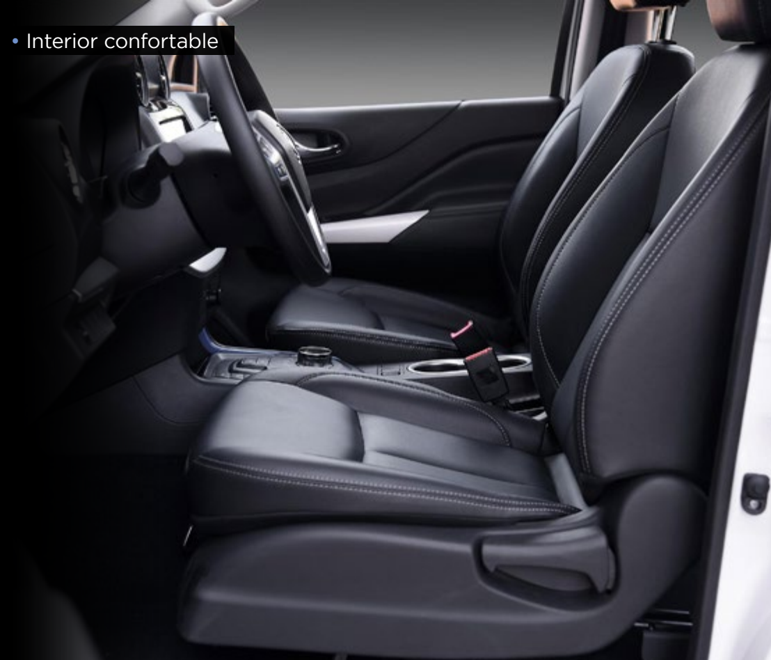
• Interior confortable