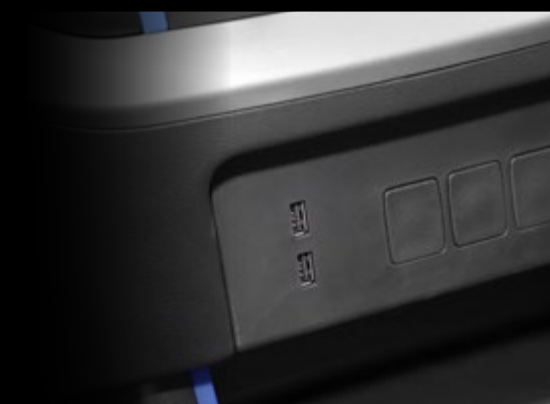
• 2 puertos USB