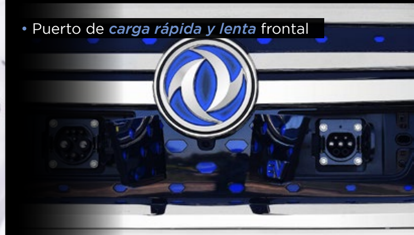
• Puerto de carga rápida y lenta frontal