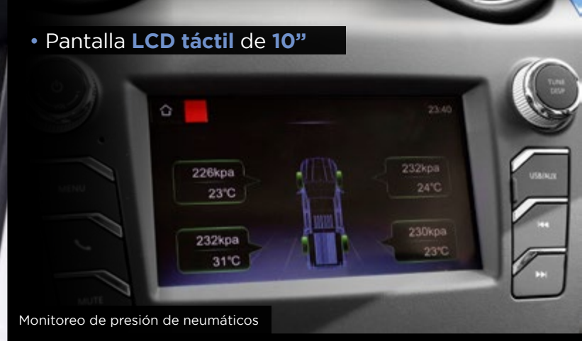
Monitoreo de presión de neumáticos