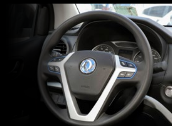
• Controles de mando en volante