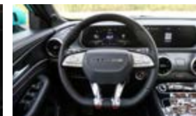
Equipamiento incluido: •

Nos reservamos el derecho de actualizar, cambiar o reemplazar cualquier especificación sin previo aviso