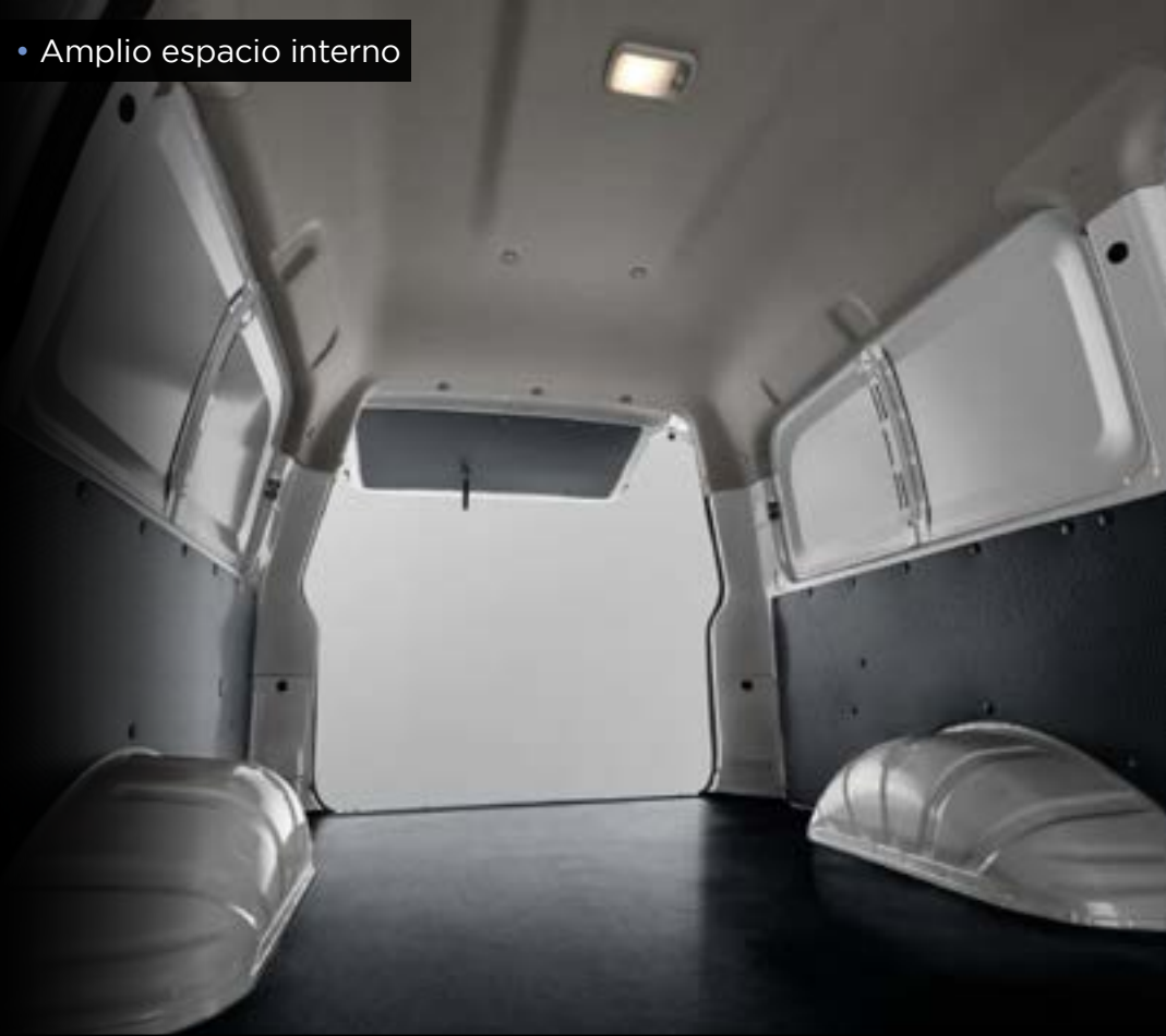
• Amplio espacio interno