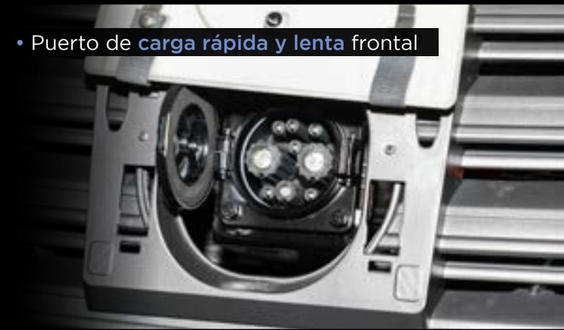
• Puerto de carga rápida y lenta frontal