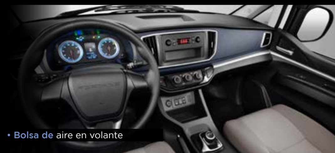
• Bolsa de aire en volante