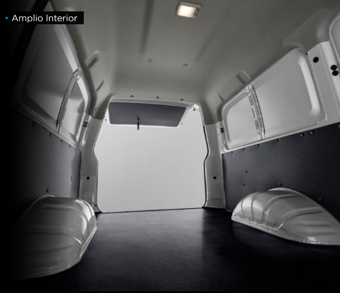
• Amplio Interior