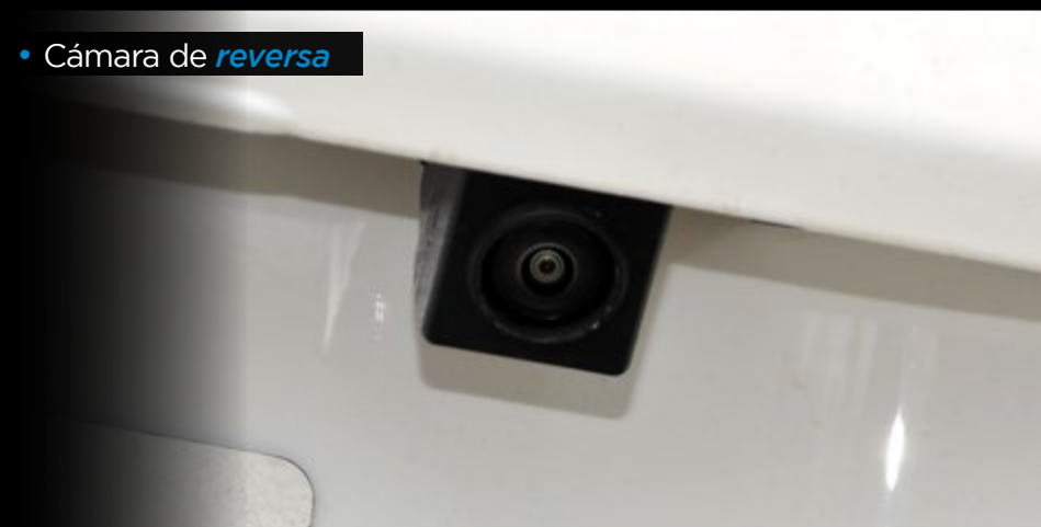
• Cámara de reversa