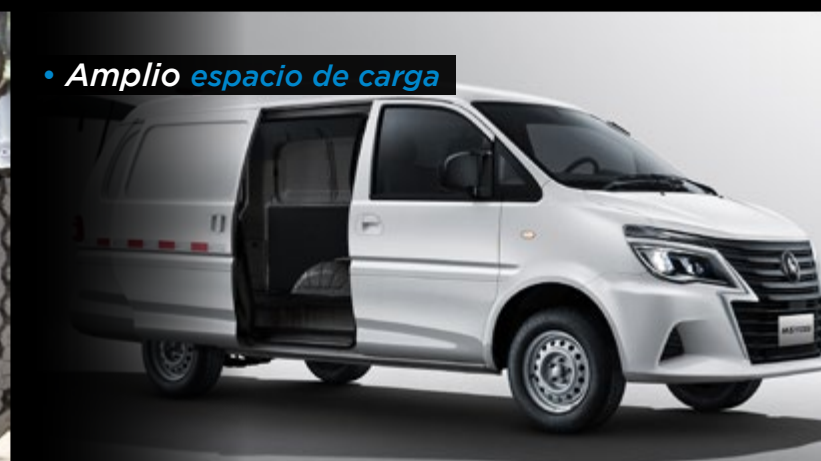
• Amplio espacio de carga