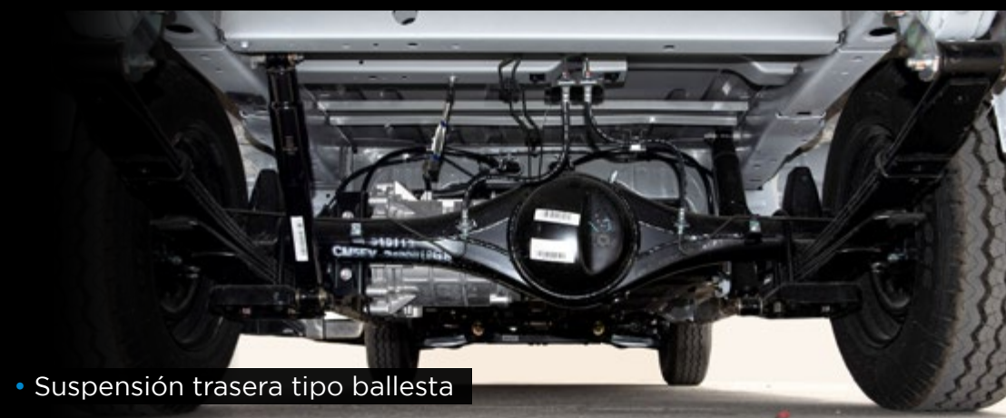
• Suspensión trasera tipo ballesta