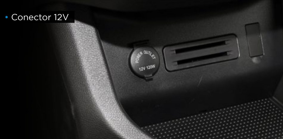
• Conector 12V