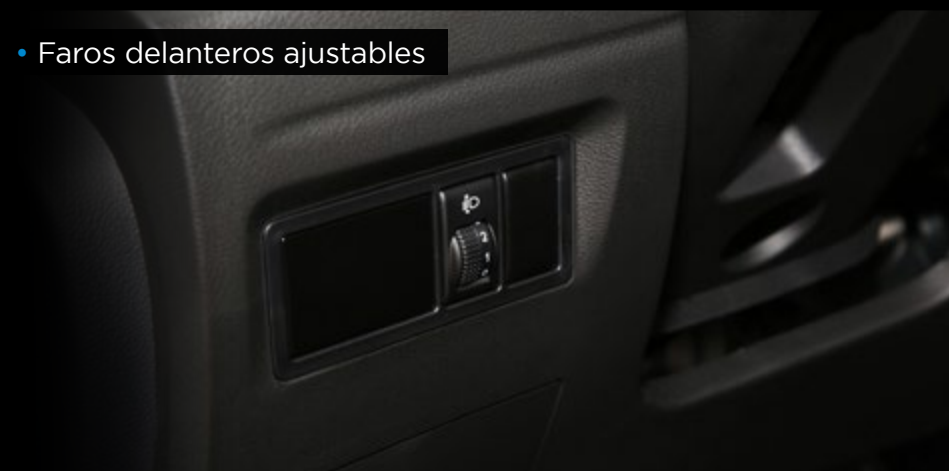
• Faros delanteros ajustables