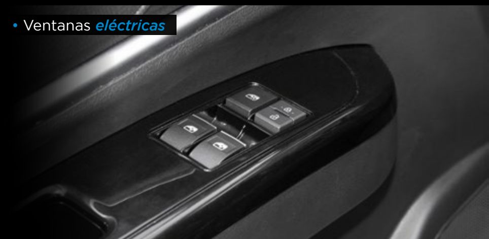
• Ventanas eléctricas