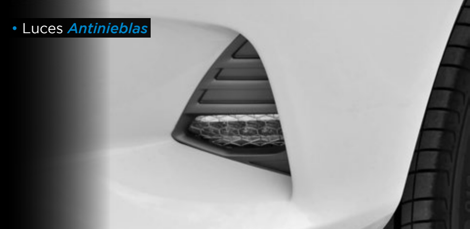
• Luces Antinieblas