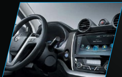
TABLERO DE SUV